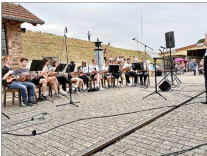
Text und Fotos: Barbara Hilpert