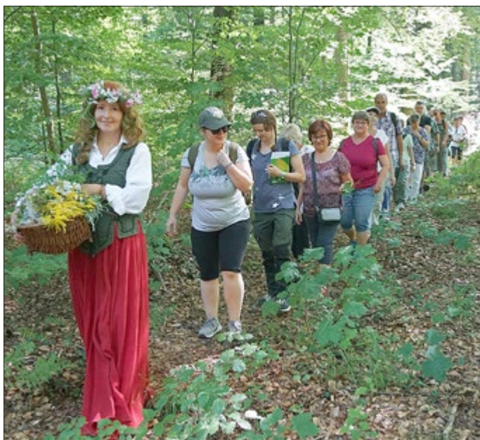
Im Gänsemarsch durch den Sommerwald. Text und Foto: Heidi Zengerling

Mit der Geschichte vom kleinen Stern und Informationen zum kosmischen Ereignis des Sternschnuppenregens um den Laurentiustag (10. August), der Anregung, den freien Blick in den Himmel zu genießen und eine lebensbejahende Stimmung aus dem Wald mitzunehmen verabschiedete Merten ihre Gäste, die den Nachmittag im Biergarten des „Alten Bahnhof“ mit einem Kräutersüppchen ausklingen ließen.