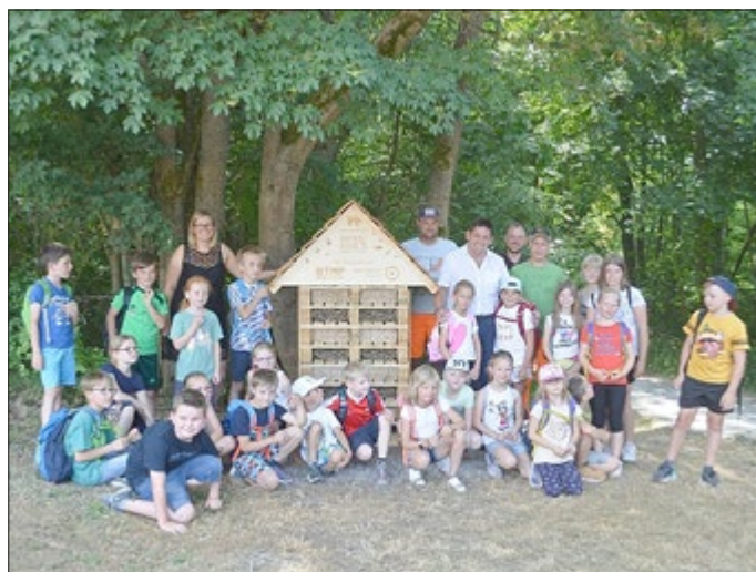
Übergabe des Insektenhotels am Rondell in Heyerode an die Landgemeinde Südeichsfeld.